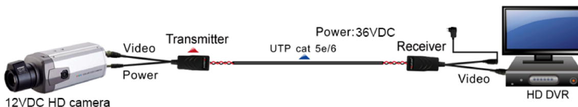
Diagrama de aplicación